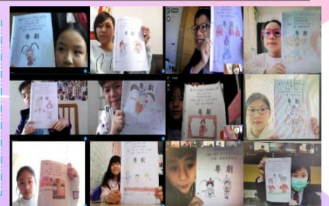
學生設計封面，你看多有創意!