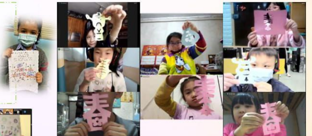
學生利用對稱的概念，設計賀年飾物。

透過認識節日的由來、習俗、慶祝活動和特色食物，加深學生對節日的理解，亦建立學生對傳統文化的尊重。