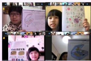
學生學懂健康地「識飲識食」。

學生認識茶餐廳的術語、飲茶的禮儀、食品的分類及健康食物。其中一部份是透過認識食物所含有的卡路里以及各類運動所消耗的卡路里，從而讓學生認識如何選擇食物及適合的運動。