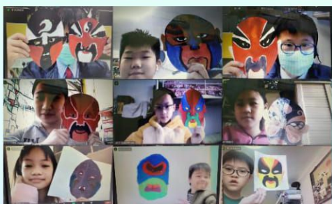
學生利用水彩壓印的方法，製作出軸對稱的面譜。